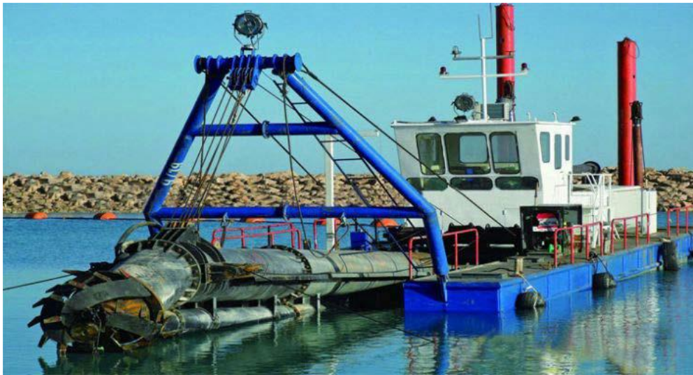
12" Cutter Suction Dredger

遺憾的是，事隔卅餘年我與 威寧兄皆未尋得當年珠江二號的照片，不得已僅能以同型船示意：