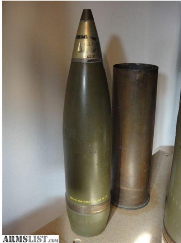
152 mm 高爆彈 示意圖

一場虛驚終告結束，如今又隔卅餘年，我已不復記憶那個受創嚴重的抽砂幫浦結局如何，但半個月後，新的幫浦從台灣運到，我們加速趕工以彌補這段意外所造成的落後。對光頭士官長及小青年們，我們敬上最深摯的感謝，如今他們應已年逾半百或近甲子，不知道在世界的某個角落，還記不記得當年這段驚險的過程，及大家在面對風險時，所傳遞的那份關懷。