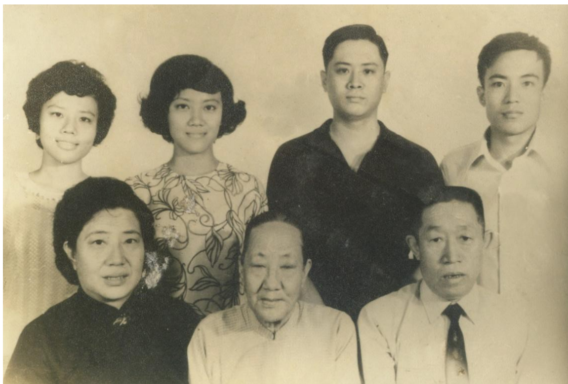
圖 16 雙親與姥姥、大哥、姊姊、三哥與我攝於 1970 年