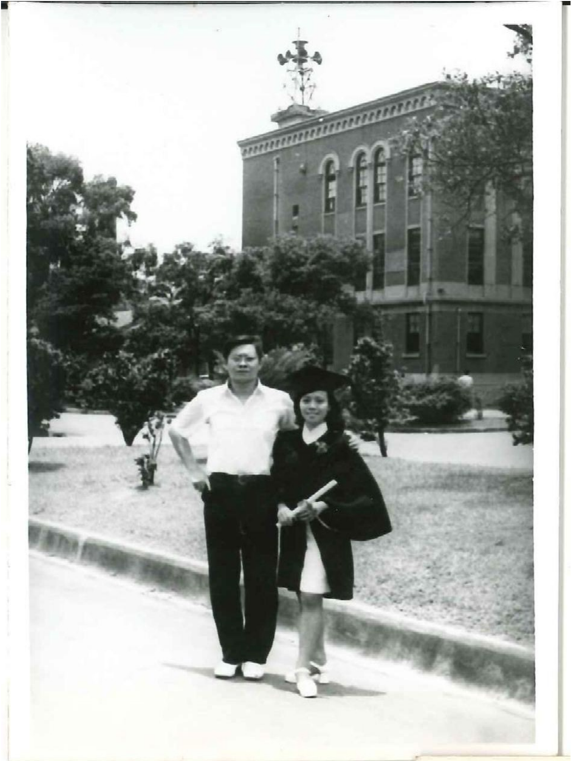
圖 12 大哥參加我的大學畢業典禮 1973 年 7 月