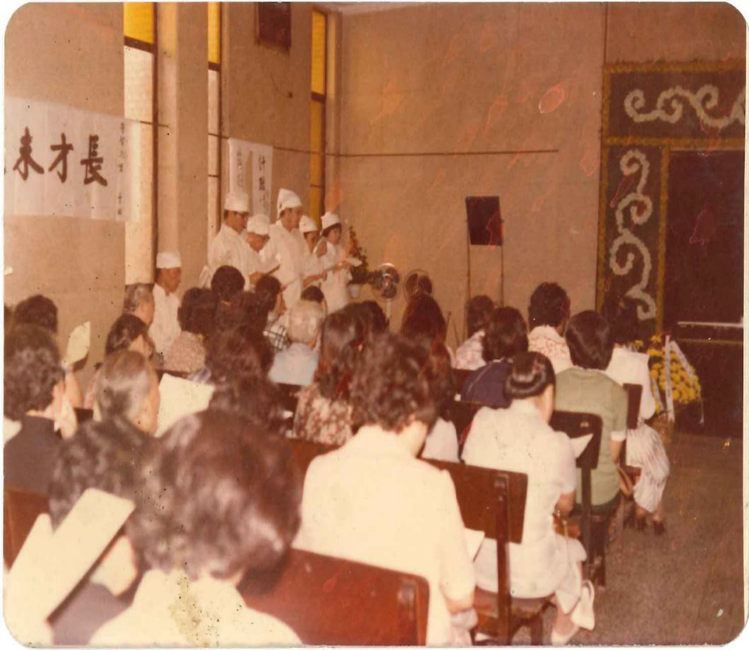
圖 20 父親的安息禮拜，臺北榮民總醫院公祭禮堂（1978 年 10 月）