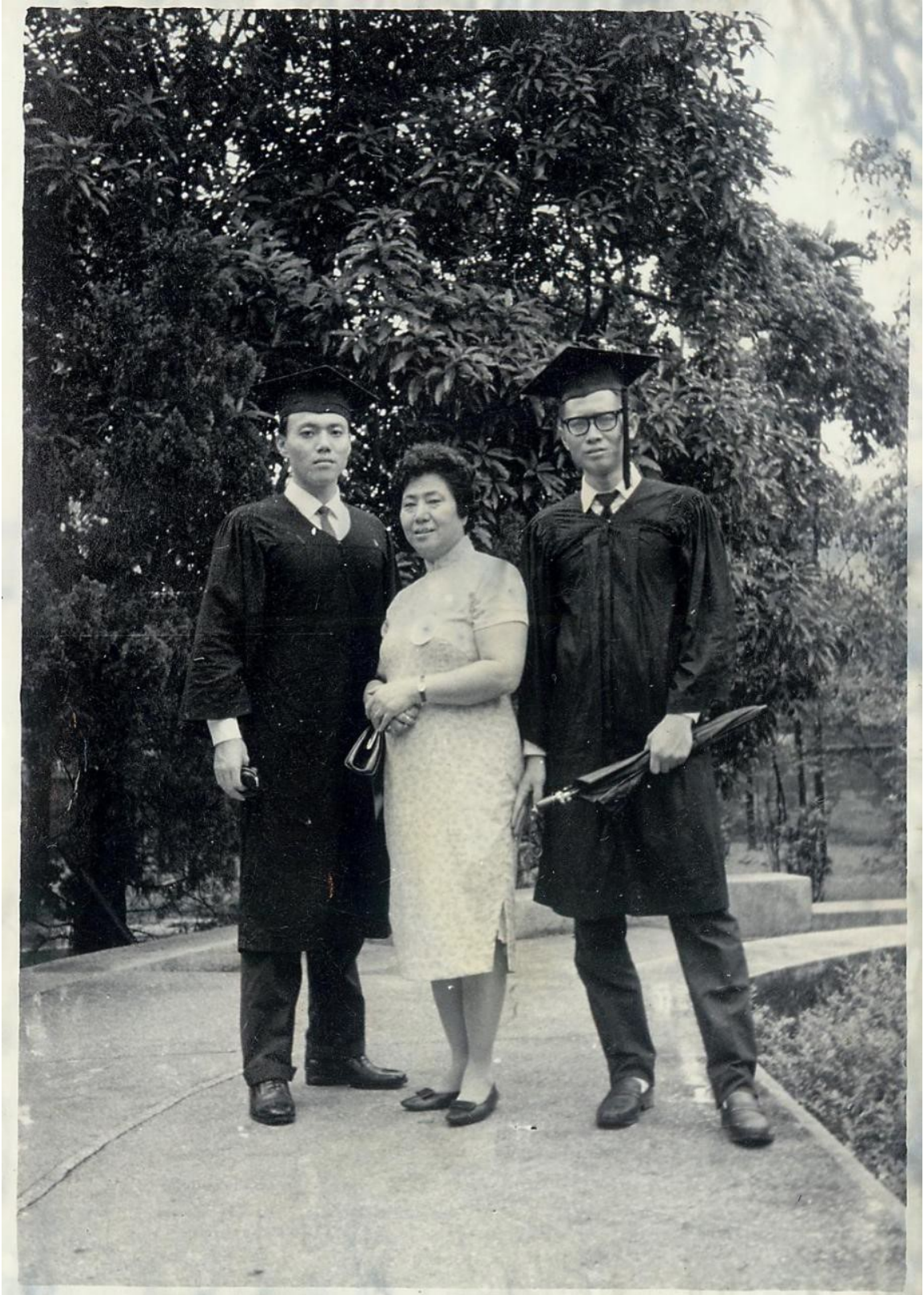
圖 9 母親參加大哥、二哥的畢業典禮，攝於校園 1969