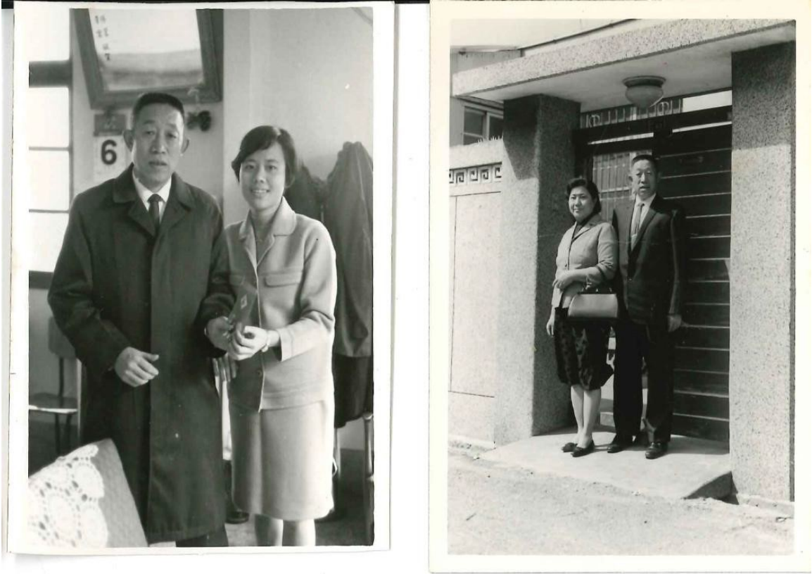
圖 6 雙親攝於吳興街（現莊敬路）國民住宅前（右，約 1970）