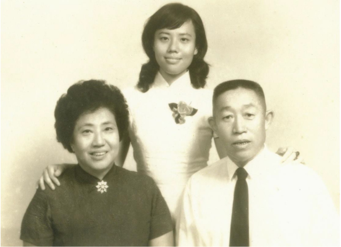
圖 11 雙親與我攝於 1973 年 7 月大學畢業典禮當天