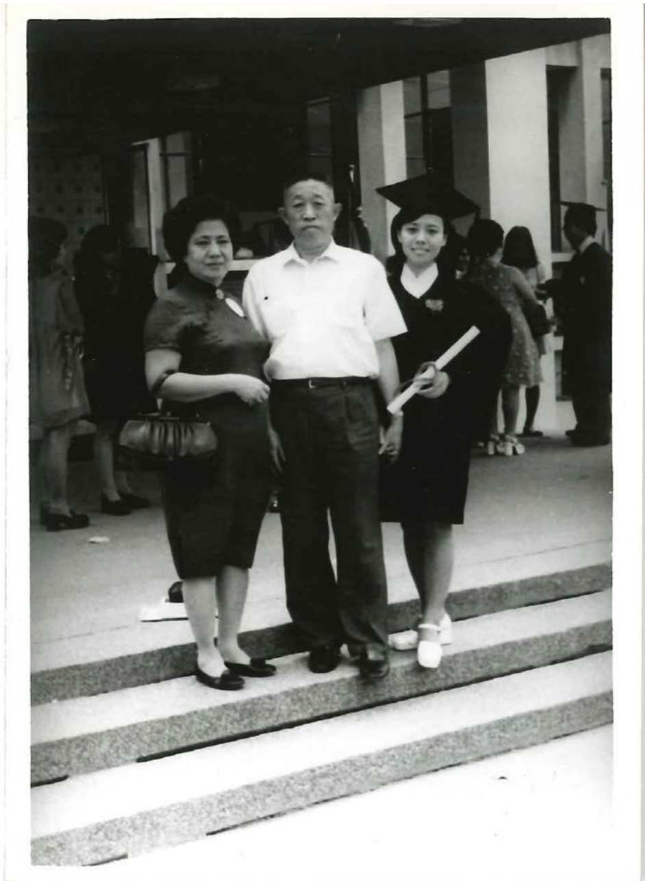
圖 10 雙親與我攝 1973 年 7 月大學畢業典禮禮堂前