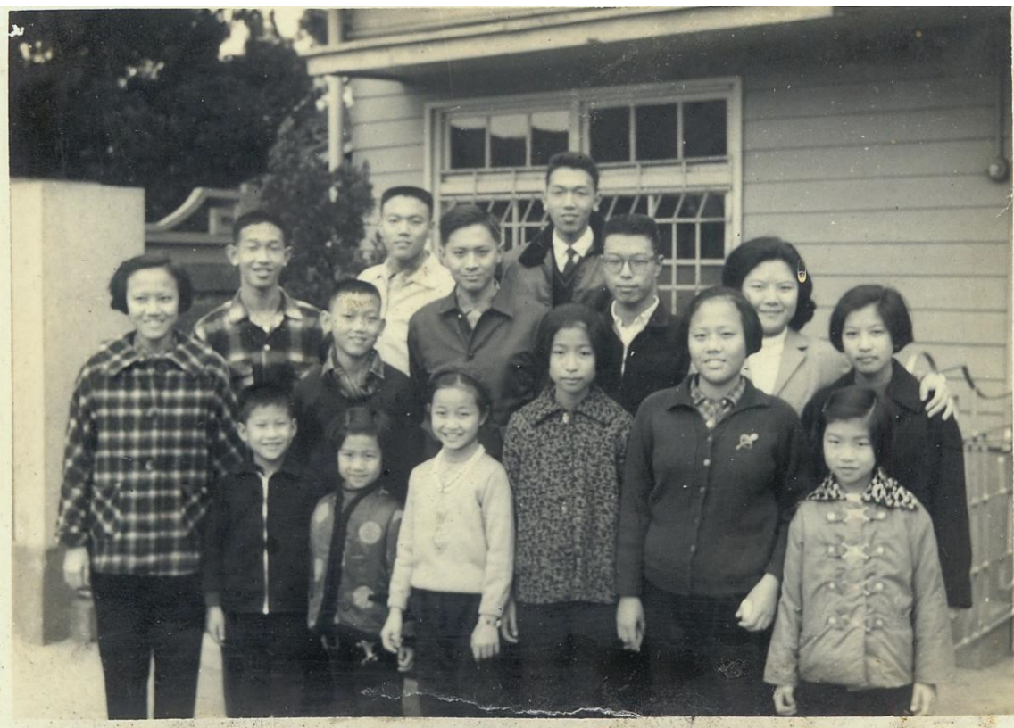
圖 4 大年初一拜完年後我們與白家、朱家、周家的蓉蓉攝於新竹中華路天主堂前，約 1960 年