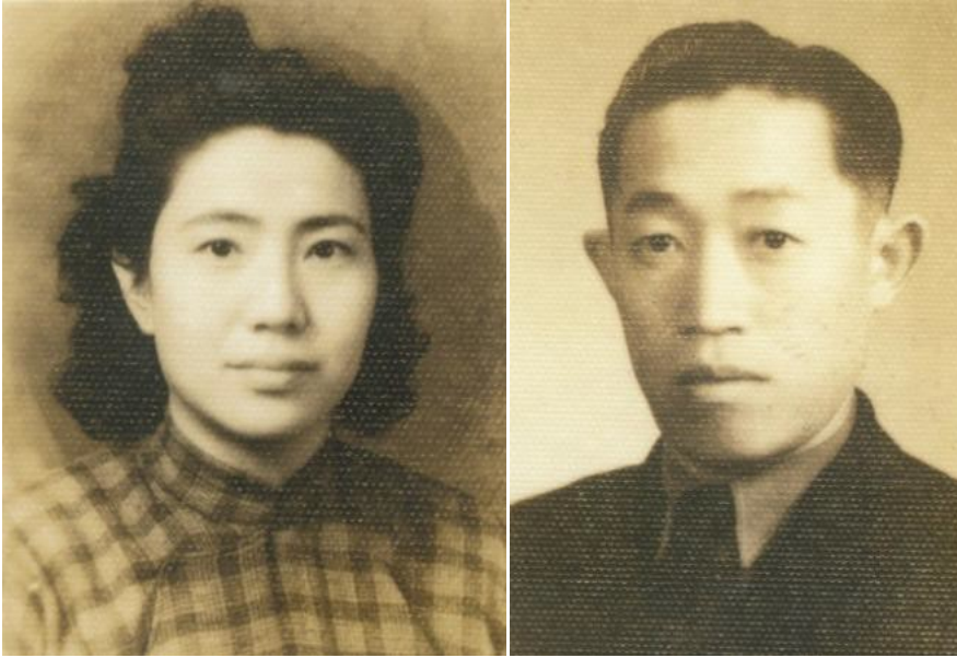
圖 1 雙親攝於抗戰時期，生下大哥、二哥之後，約 1947 年