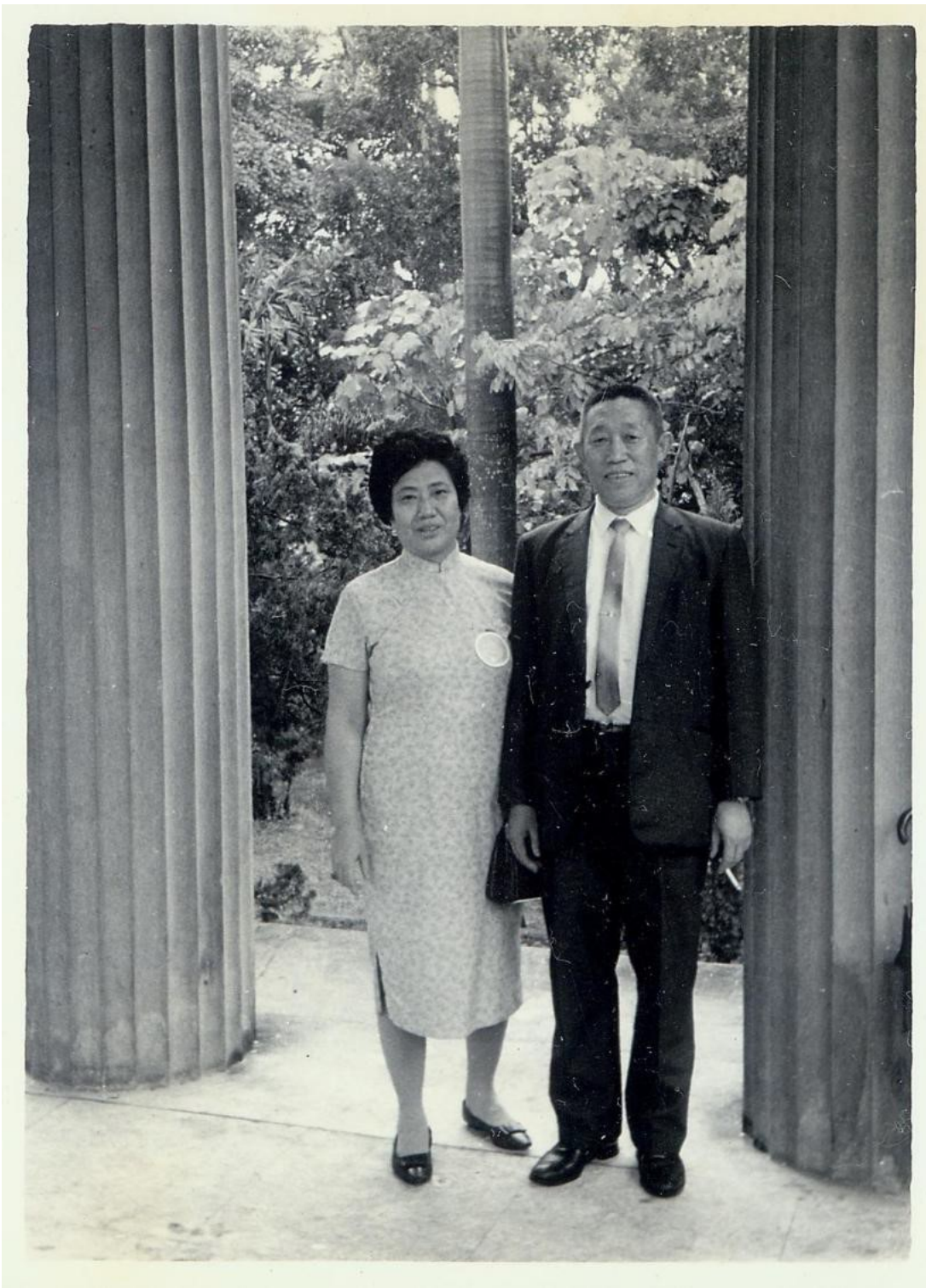
圖 8 慈愛的雙親參加大哥、二哥的畢業典禮，攝於傅園 1969 年