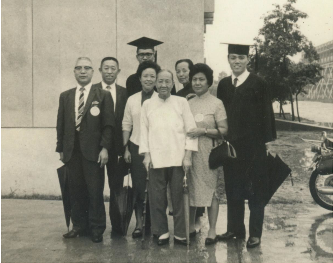
圖 7 雙親偕姥姥，孟伯伯、孟媽媽、邢姥姥參加大哥、二哥的畢業典禮 1969 年