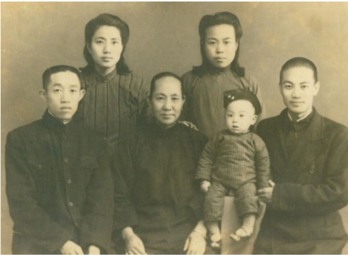
圖 2 父母親於大哥昭恆周歲時與姥姥、舅舅、姪姪合影 1945 年