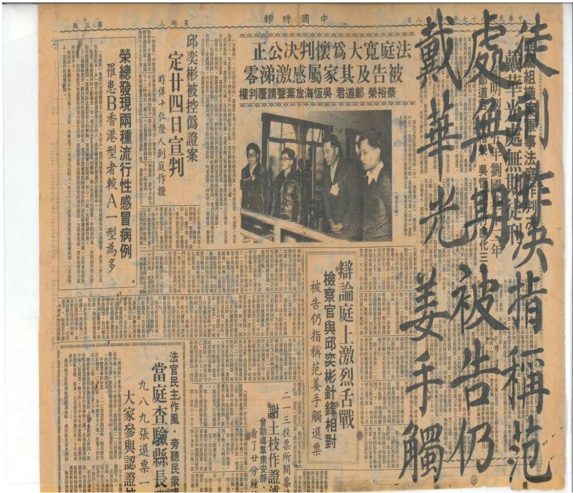
圖 5 父親生病後，經母親的鼓勵，重拾起筆墨，信手在報紙上揮灑一番（1978年），這些墨寶成為我一生的珍藏！